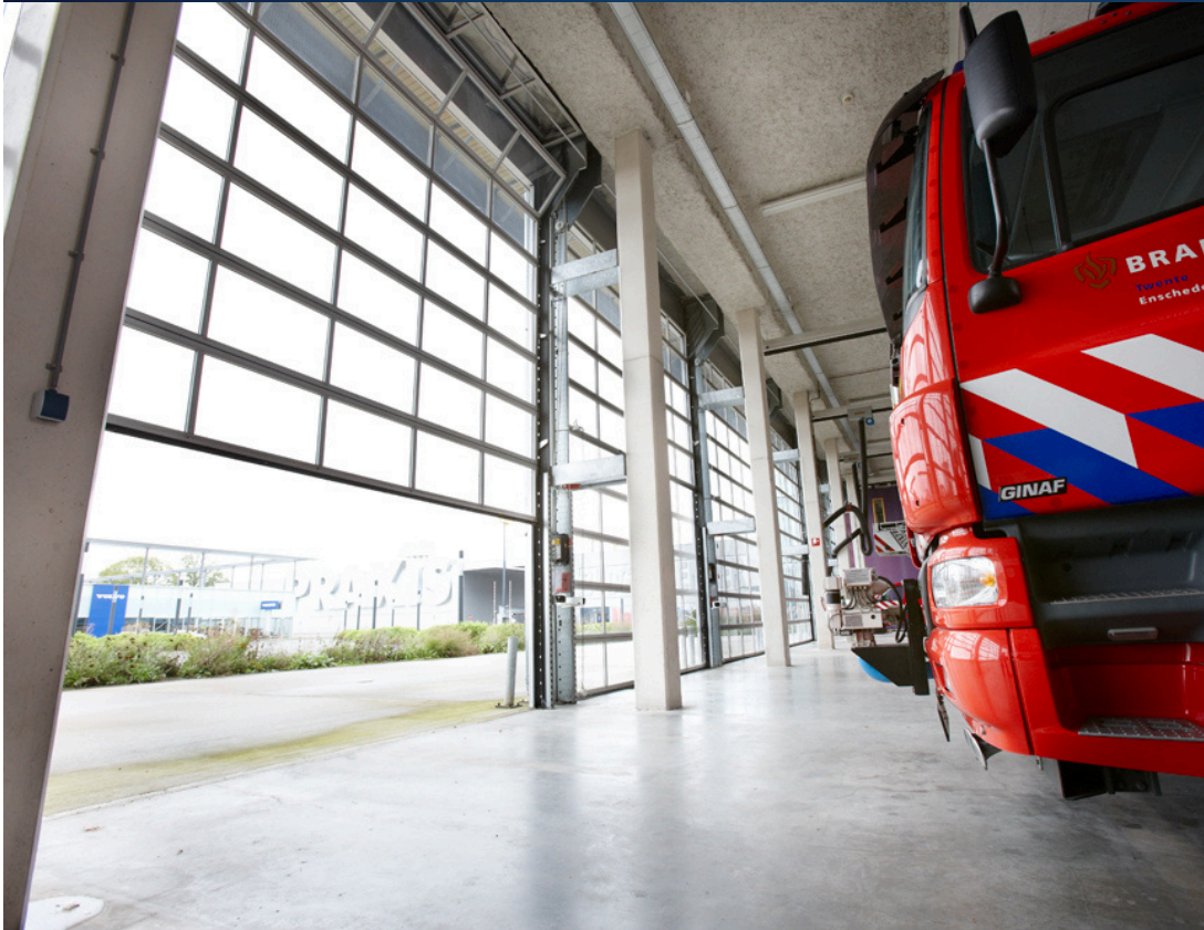
Project: Brandweer Hoewelaken Netherlands