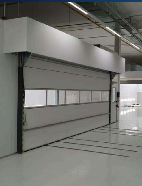
Project: Van Mossel, Netherlands