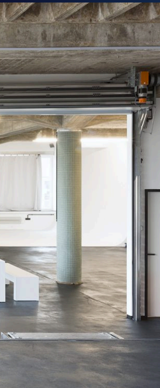
Project: RAW Studios, Berlijn, Duitsland