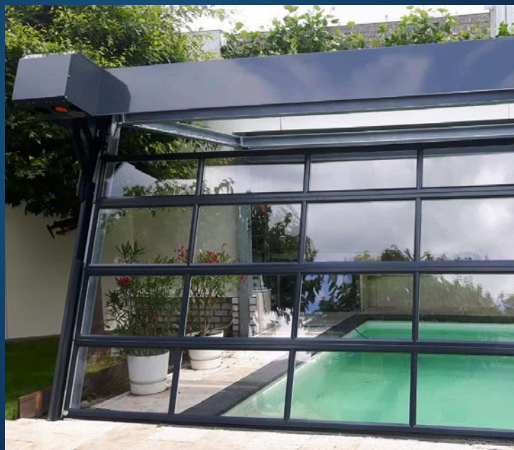
Project: Privézwembad, Nederland

Als u alle ruimte binnen nodig heeft, kunt u de deur aan de buitenkant monteren. Alle bewegende delen bevinden zich dan buiten de ruimte of zelfs buiten het gebouw. Deze optie wordt vaak gebruikt voor spuitcabines en autowasstraten.