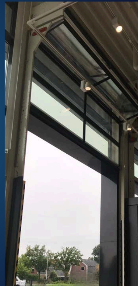
Project: Mercedes Baan Nederland