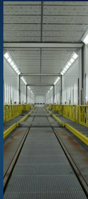
Project: Onderhoudscentrum OV MIVB-STIB, Brussel, België